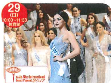
2017ミスインターナショナル 美の親善大使 来場 写真は2016年世界大会優勝 フィリピン代表/カイリー・バーサさん