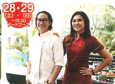
Revood Revaldi & Rissa (Revood) 国際シェフ・インドネシアのマスターシェフ来場