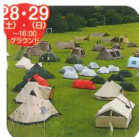
テントの展示会(雨天中止) sotosotodays

From kids to elders, everyone will enjoy this special event featuring by International chefs, finalists of Miss International Beauty Pageant and more!