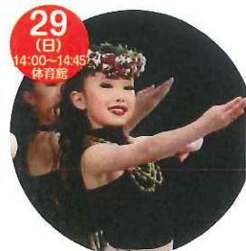
ハワイアンフラダンスショー Halau Hula Kau Ka Maka